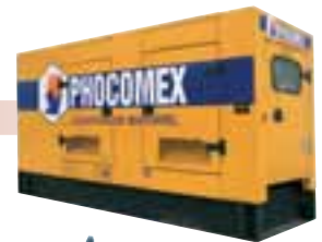
GE 250 Kva 380 v