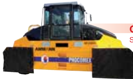
Compacteur sur pneus