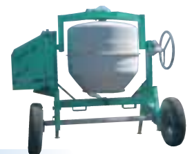
Bétonnière 340 l