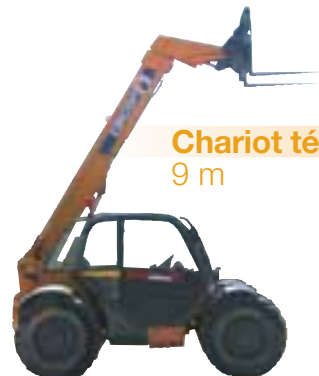
Chariot télescopique 9 m