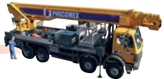
Nacelle sur PL 46 m